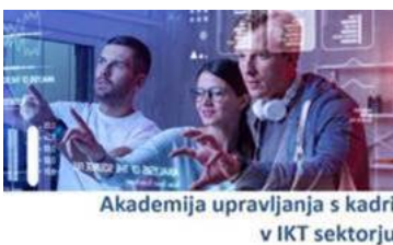
Akademija upravljanja s kadri v IKT sektorju